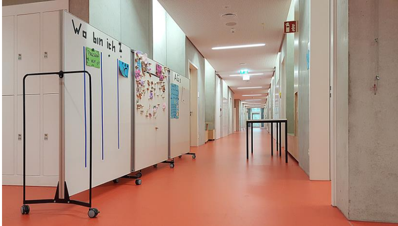
Flur / Eingang Ganztagsräumlichkeiten